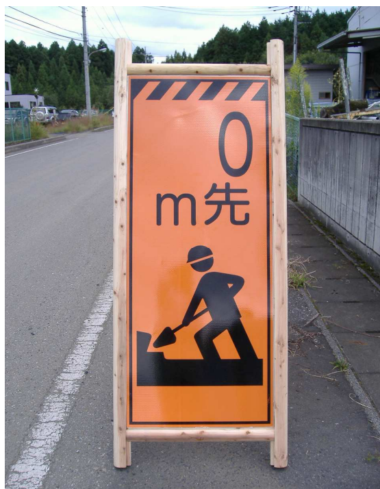
タイプB型 (高輝度反射板)