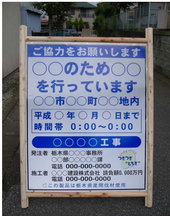
タイプA型 (高輝度反射板)