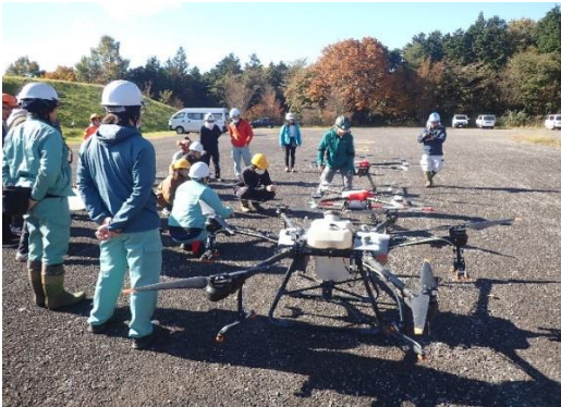
機体の説明の様子

近年林業界においては、測量や資材運搬等の労力削減や低コスト化のために、ドローンの活用が進められています。県森連では、令和4年度にスマート林業化促進の一貫として、計5台のドローンを導入し、苗木や獣害対策資材運搬、薬剤散布の業務委託をいただくなど、徐々に活用を進めてきました。