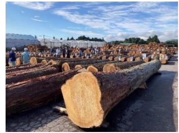
優良材の展示（鹿沼木材共販所）

展示会の開催は関係森林組合のご尽力はもとより、組合員の皆様をはじめとします関係各位のご協力の賜物です。心より感謝申し上げます。