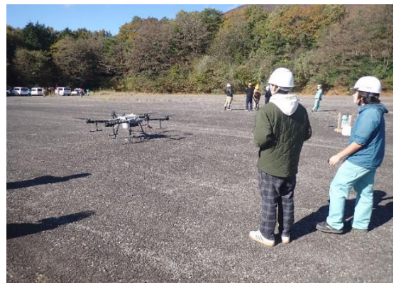
操縦体験する林大生

2日目には学生の皆さんに、運搬ドローンの操作を体験していただきました。実習は県森連職員の指導のもと、県民の森駐車場で実施し、ドローンの機体の大きさや音、風力を実際に肌で感じていただきました。