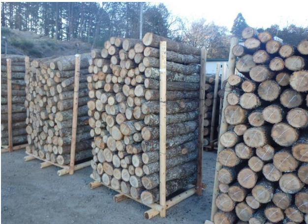
令和6年12月下旬に大分県から入荷した原木

東日本大震災に伴う原発事故から10年以上が経過しますが、県内のしいたけ原木林は広範囲に汚染され、依然として安全な原木の需要を賅える状況にあるとは言えません。