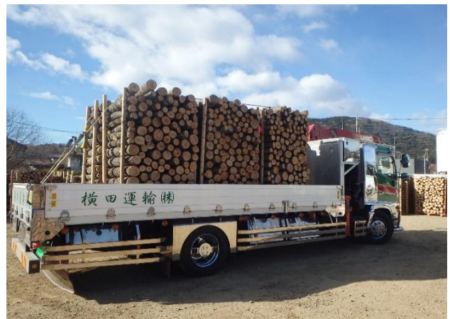
トラックで配送される原木

さらに、一日も早く県内産の安全な原木を生産者にご利用いただくため、県内原木林の萌芽更新や植栽による再生に向けた実証的な取組も引き続き行ってまいります。